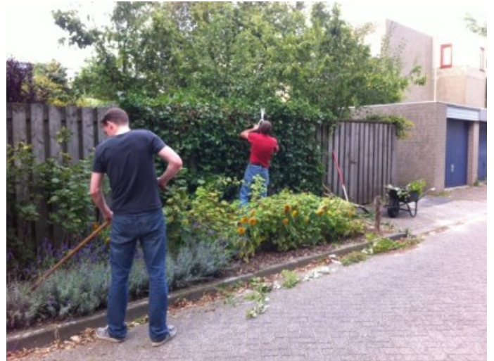
Samen de wijk onderhouden.

Facebook. De samenwerking met 'Rond 't Hofke' is daar ook een gevolg van. Misschien is het recente initiatief in de Doornakkers ook een idee voor ons? Wat valt me zo nog op in de wijk?