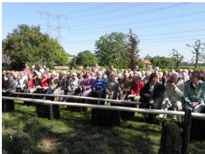
Een groep mensen tijdens een mis tegenover 't Kapelletje

Een jaar geleden waren we met ruim 500 personen bijeen rondom de Mariakapel aan de Loostraat. Het was een geweldige reünie van mensen, van wie er verscheidenen 60 jaar tevoren betrokken waren bij de bouw en inzegening in 1954. Een prachtige bijeenkomst bij de boerderijen van de familie Rovers, voorafgegaan door een eucharistieviering met een ervaringsvolle preek van de pastoor, die daags tevoren terugkwam van bedevaart naar Lourdes.