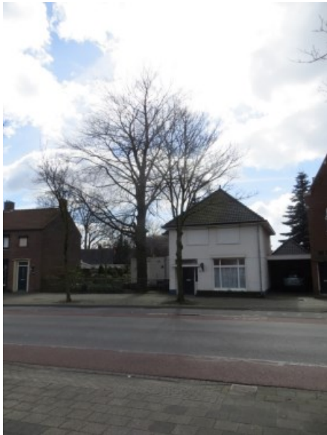
Rode Beuk `t Hofke 18

Op 't Hofke, ter hoogte van nr. 18, staat een mooi exemplaar net naast het huis aan de voorzijde.