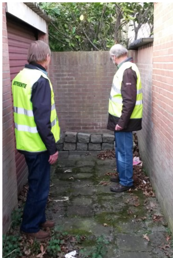
Vrijwilligers van het buurtpreventieteam aan het werk.

Hier delen we actief informatie over het Buurtpreventieteam en de onderwerpen die bij het Leefbaarheidsteam besproken worden. Op deze manier proberen we de wijk actief te informeren en te betrekken bij de veiligheid van onze wijk.