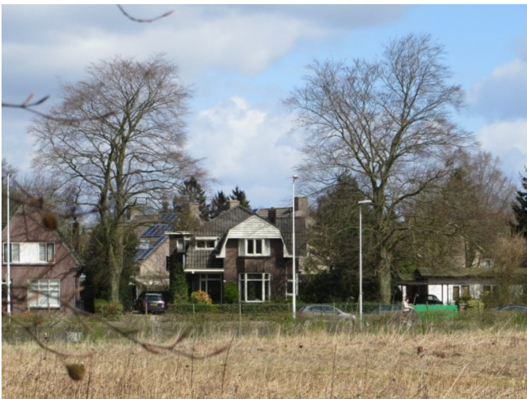
Koudenhovenseweg Zuid gezien vanuit het beukenlaantje. Let dadelijk op het uitlopende rode blad. Prachtig!

Dan staat er in het Wasvenbos ook nog een rode beuk van minimaal 180 jaar, vastgezet aan kabels. De boom is aangetast door een tonderzwam, die vreet het binnenste van de boom op, zeg maar. Er was 3 jaar geleden nogal wat discussie: wat te doen met de aangetaste beuk? Na een aantal