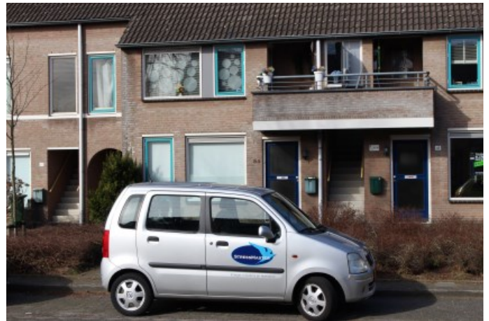
De praktijkruimte en Stressmasterauto aan de Locomotiefstraat.

Rond 2005 gingen we op zoek naar een eigen praktijkruimte. Dat viel niet mee. Je bent al gauw aangewezen op bedrijfsgebouwen waar je vaak 's avonds niet eens meer terecht kunt omdat het gebouw op slot gaat. Dat moesten we juist niet hebben. Toen hoorden we dat woningcorporatie Trudo deze huurwoningen aan de Locomotiefstraat in de verkoop deed en daar zijn we toen, tot ons geluk, voor ingeloot.