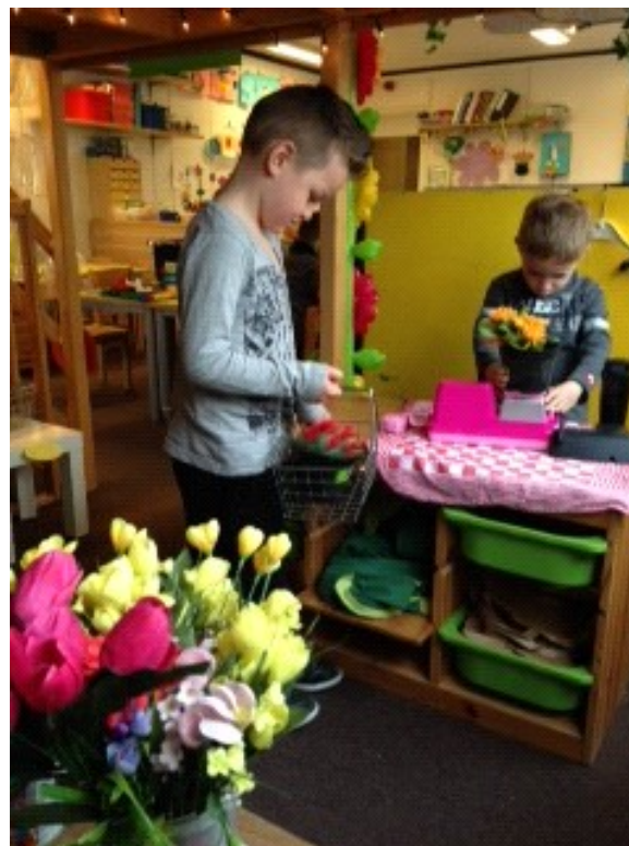
De kleuters 'in het tuincentrum'.

Natuurlijk kunt u via deze manieren ook reageren op dit artikel.