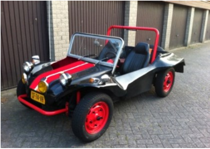
De zwarte strandbuggy.