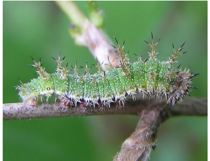
Groene stekelige rups

Van half juli tot eind juni het jaar erna, is het een rups.